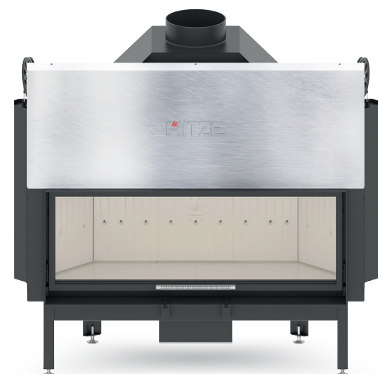
WKŁAD KOMINKOWY AL 120x43 G.H

W drzwiczkach kominka umieszczone jest żaroodporne szkło ceramiczne o temperaturze pracy do 800°C. Wkład wyposażony jest w kurtynę powietrzną gwarantującą w znacznym stopniu utrzymanie efektu czystej szyby i panoramicznej wizji ognia. Istnieje możliwość zamówienia drzwi z szybą łączoną lub szybą giętą.