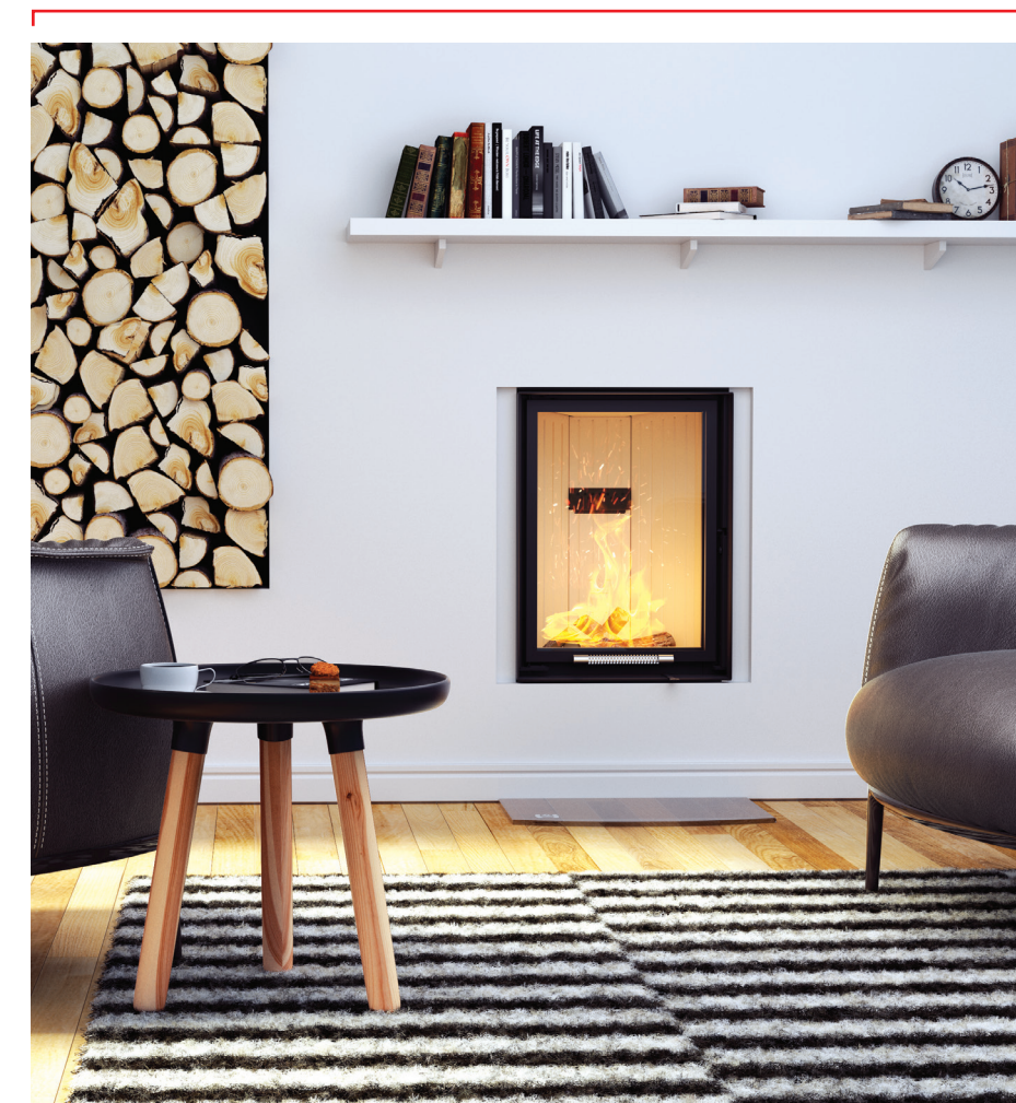
Wkład kominkowy ALBERO AL11 GV