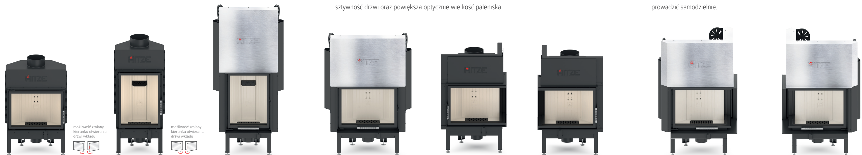
ALBERO AL11 S.H ALBERO AL11 S.V ALBERO AL11 G.V ALBERO AL11 G.H ALBERO AL11 R.H ALBERO AL11 L.H ALBERO AL11 RG.H ALBERO AL11 LG.H